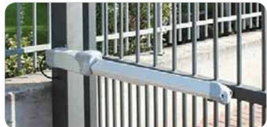
Particular de instalación sobre la hoja