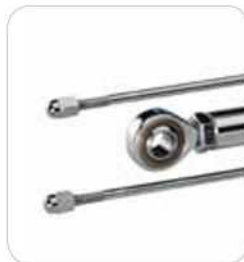
Ataque anterior con cabeza articulada ajustable