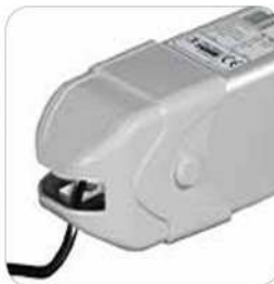
Particular de cofia de cobertura posterior