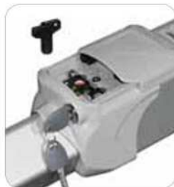
Bandeja tapa deslizante para la liberación y el ajuste hidráulico